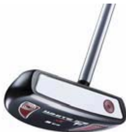
#5 CS(センターシャフト)