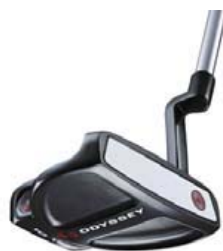
2・Ball CH(クランクホーゼル)

ブレードタイプの2・Ball形状ではなく、ツアーで根強い人気のオリジナルの2・Ball形状に操作性に優れたクランクホーゼルを装着。イン・ストレート・インのスムーズなストロークを実現しました。