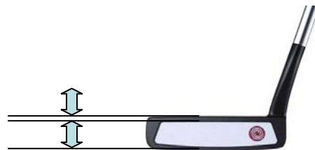
従来の#9に比べて2mmディープ